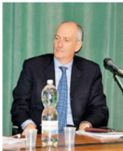
Il prefetto Franco Gabrielli alla conferenza

quella cultura della consapevolezza che spinge ognuno di noi a essere informato dei rischi che esistono sul nostro territorio, dei comportamenti che devono essere adottati, delle attività che le istituzioni sono tenute a intraprendere, questo Paese potrà dotarsi di sistemi tecnologicamente avanzati o di progetti ambiziosi, ma se questa cultura non innoverà i comportamenti dei cittadini, non riusciremo a fare passi avanti».