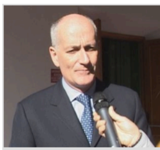
Franco Gabrielli ai microfoni di TeleElba

Il progetto Argomarine, coordinato dal Parco Nazionale dell'Arcipelago Toscano e cofinanziato dall'Unione Europea, ha l'obiettivo di monitorare il traffico e l'inquinamento marino all'interno di aree di elevato pregio ambientale, quale l'Arcipelago Toscano, utilizzando le migliori tecnologie esistenti. E questo è stato il tema del convegno internazionale organizzato a Portoferraio al centro culturale De Laugier, sul monitoraggio e la sicurezza della navigazione delle aree marine protette. L'evento ha visto la partecipazione di esperti da tutti gli stati membri dell'Unione Europea, impegnati attivamente nel monitoraggio dell'inquinamento da idrocarburi del mare.